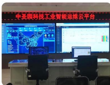
工业智能运维云平台