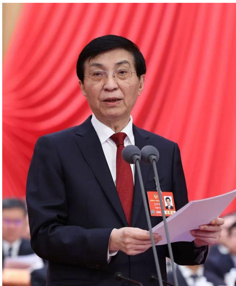
3月10日上午，中国人民政治协商会议第十四届全国委员会第三次

闭幕会，看望政协委员并参加联组讨论，同政协委员们共商国是。全体政协委员认真讨论政府工作报告和其他报告，认真审议政协常委会工作报告和提案工作情况报告等文件，取得丰硕议政成果。全体政协委员高度评价过去一年以习近平同志为核心的党中央统揽全局、沉着应变，团结带领全党全国各族人民攻坚克难、砥砺奋进，顺利完成经济社会发展主要目标任务，推动中国式现代化取得新的重大成就；一致表示要深刻领悟“两个确立”的决定性意义，增强“四个意识”、坚定“四个自信”、做到“两个维护”，进一步坚定夺取新时代中国特色社会主义新胜利的的决心和信心。