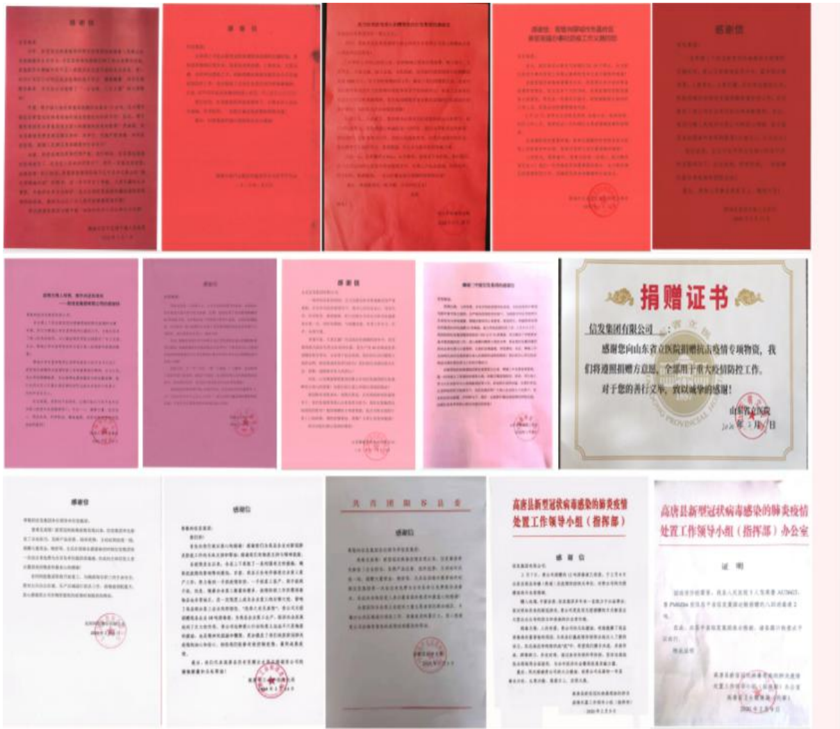
这是信发集团收到部分感谢信、旌旗、捐赠证书总共 40 余份

进道路上的一切艰难险阻。在党中央的坚强领导下，全国人民同心协力、英勇奋斗、共克时艰，一定能取得疫情防控斗争的全面胜利！